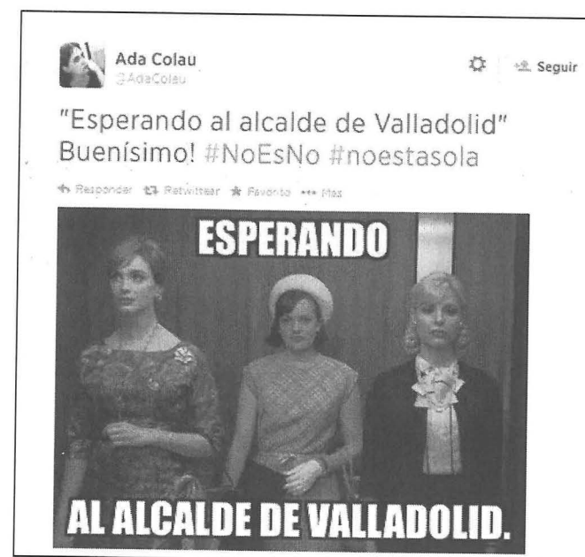
IMAGEN 1: Tuit publicado en el perfil de Twitter de Ada Colau (@AdaColau) el 22-08-2014. Disponible en: < https://twitter.com/AdaColau/status/502901723535773697 >, consultado el 01-09-2014

A continuación, Colau manifestó su opinión de que el edil vallisoletano se merecía «una lluvia de sujetadores y zapatos de tacón» en su próximo acto público, a lo que una de sus seguidoras en Twitter respondió con una imagen de un sujetador. La activista catalana retuiteó , es decir, reenvió este mensaje a través de su propio perfil, para otorgarle mayor difusión, y añadió el hashtag 5 #EscacheDeSujetadores, animando a otras usuarias a llevar a cabo una protesta virtual mediante la publicación de imágenes de sujetadores en sus cuentas: