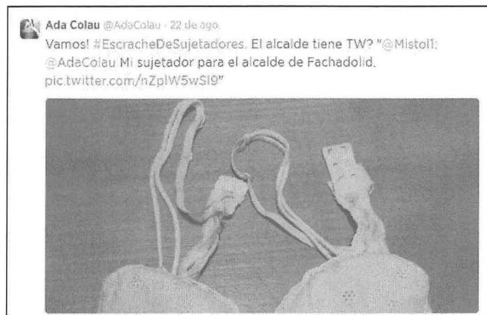
IMAGEN 2: Tuit publicado en el perfil de Twitter de Ada Colau (@AdaColau) el 22-08-2014. Disponible en: < https://twitter.com/AdaColau/status/502909836850626560 >, consultado el 01-09-2014

Esta iniciativa tuvo una extraordinaria acogida 6 , pero no solo entre las usuarias, sino también entre los internautas varones, que tuítearon imágenes de su ropa interior o incluso de sujetadores que portaban sobre su torso. Además, el «escrache virtual» fue más allá de Twitter, ya que medio centenar de personas se concentró frente a la sede del consistorio de Valladolid, que fue rodeado por una cadena de sujetadores y por múltiples pancartas que abogaban «por una ciudad libre de alcaldes machistas».